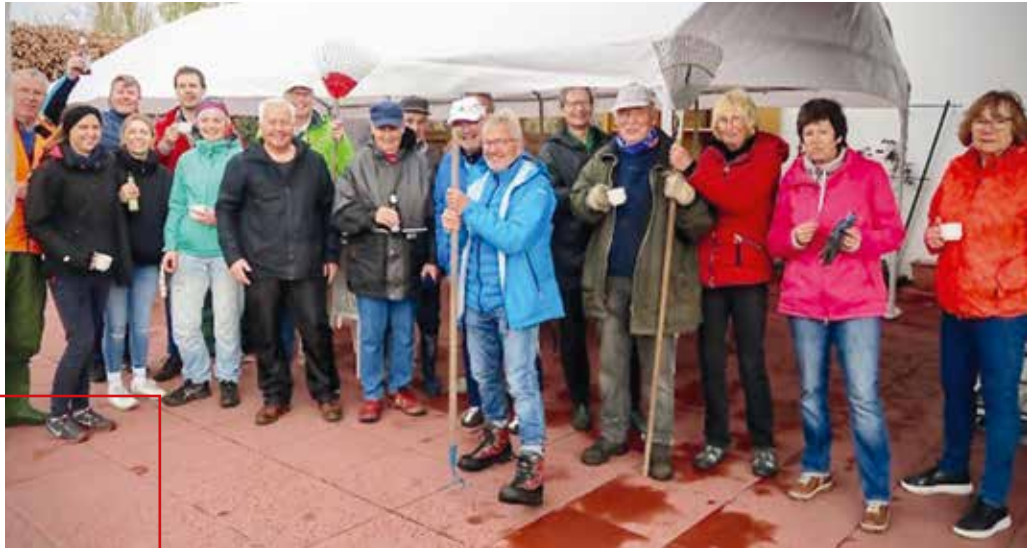
Ein super Team zur Aufräumaktion

MANCHE DINGE SIND SO SIMPEL: VIELE SCHAFFEN VIEL.