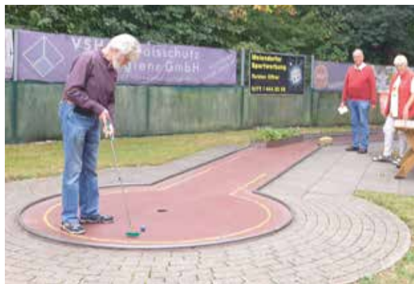
„Putten“ mit voller Konzentration