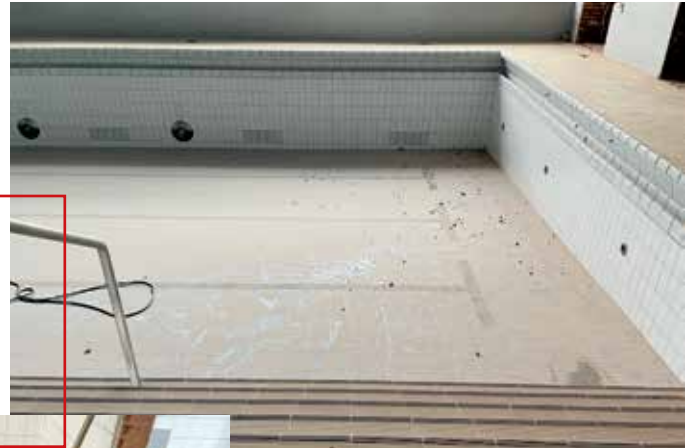
Umkleide und Becken