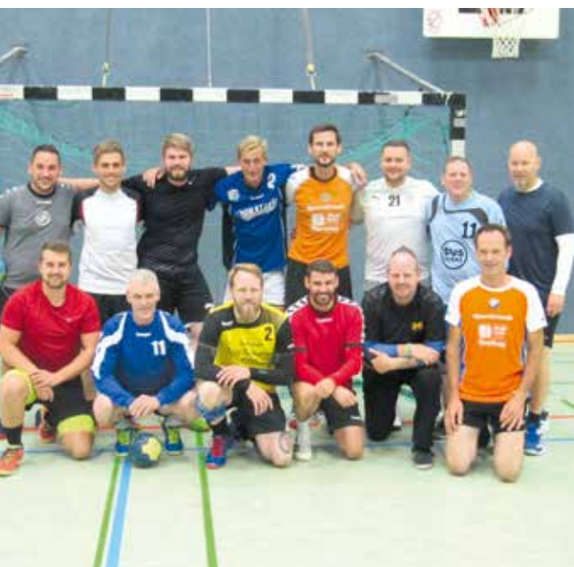
Unvollständiger Kader beim Training

Die Handballabteilungen von Oberalster VfW und des FTV trauern um