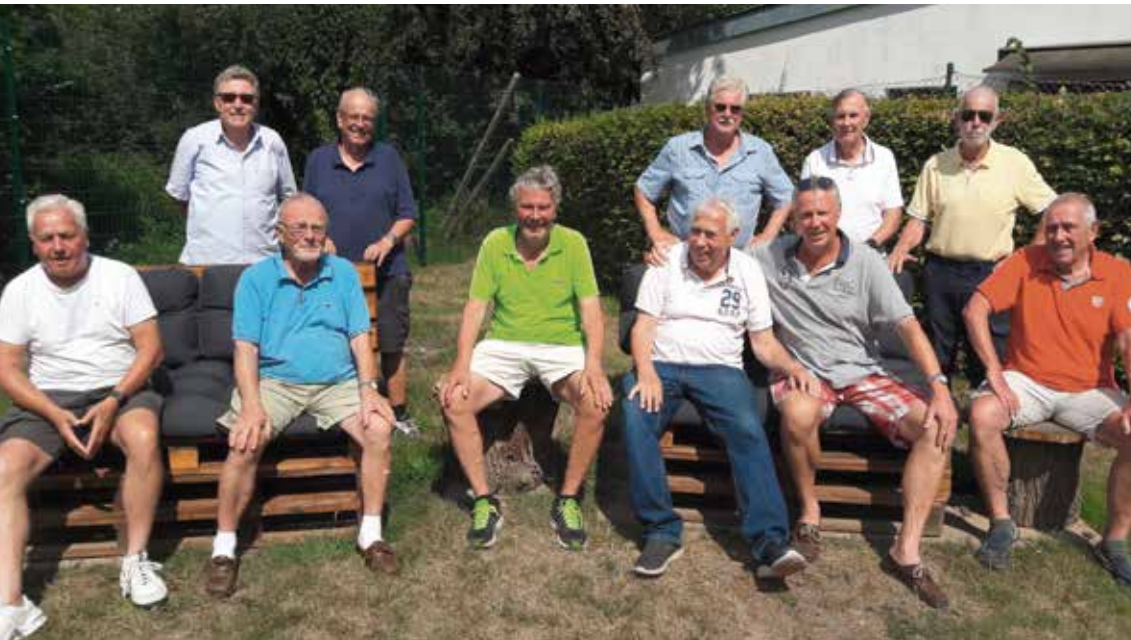
Die Spieler der Mannschaften Farmsen 1 und Farmsen 2