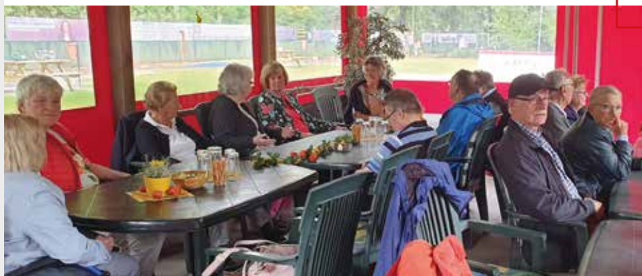
Beisammensein im wettergeschützten Pavillion