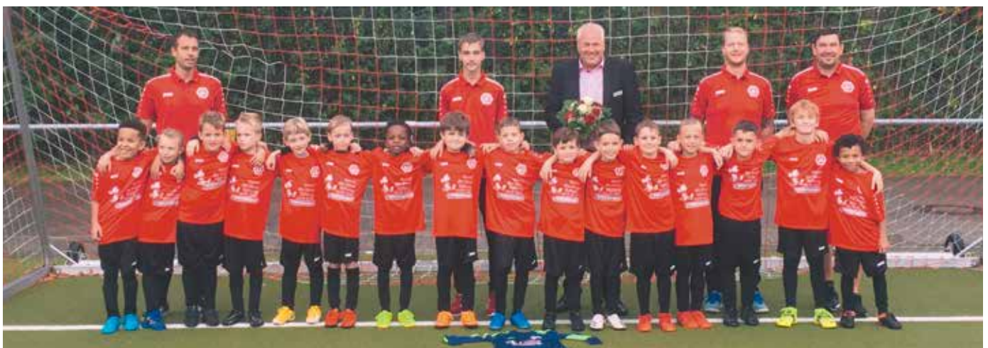
Neu eingekleidet präsentieren sich stolz die F-Junioren

An dieser Stelle möchten wir die Gelegenheit nutzen um einen Aufruf zu starten sich bei Interesse zum Trainer-Dasein sich bei uns zu melden. Wir unterstützen bei der Ausbildung und freuen uns über jede Unterstützung.