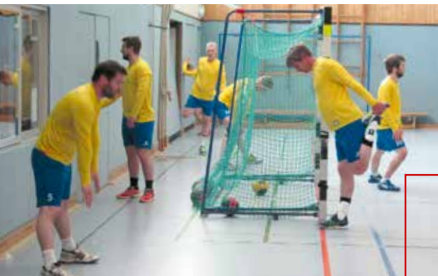
Dehnen und aufwärmen

In der letzten Ausgabe des Sportechos berichteten wir, dass wir mit Abschluss der Hinrunde 21/22 Herbstmeister geworden sind und schon 2 Spiele in der Rückrunde absolviert hatten. Wir hatten aus der Hinrunde 2 Verlustpunkte mitgenommen