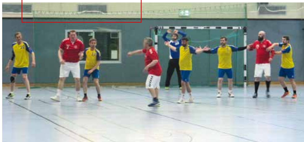
Der „Kleine“ hat den „Großen“ fest im Griff

Bilder vom „Endspiel“ gegen den TSV Stellingen am 14.05.2022