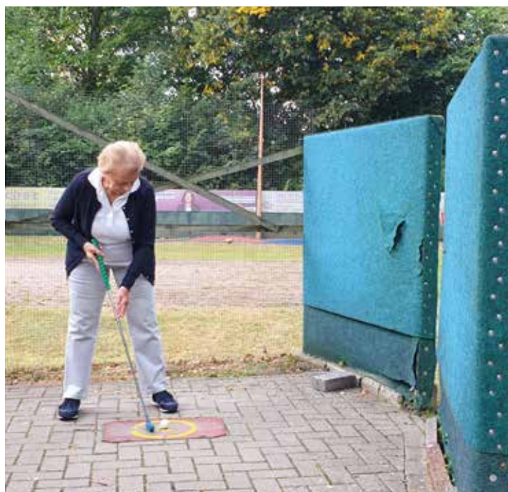
Nun heißt es üben, üben, üben ...

Auf dem Gelände gibt es einen abgeschlossenen, wettergeschützten Pavillion, in dem wir alle zusammensitzen konnten. Auf den Tischen waren hübsche Herbstdekorationen und ein bisschen Knabbereien für zwischendurch. Diesmal losten wir mit Spielkarten Gruppen mit je 3 Spielern aus, damit man an mehreren Bahnen zur gleichen Zeit spielen konnte. Überall bei den Bahnen gab es Sitzmöglichkeiten, damit man sich zwischendurch auch ausruhen konnte. Nun ging es los und nach ca. 2,5 Stunden waren alle mit den 18 Bahnen fertig und wir haben uns