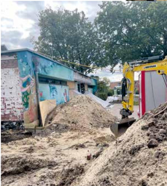
Außen wie innen bleibt kaum ein Stein auf dem anderen

hielten wir die Information, dass sich die Baumaßnahme trotz intensiver Bemühungen für die Vergabe der Bauleistungen deutlich verzögert. Die allgemeinen Engpässe für die Lieferung von Baumaterialien und die sehr ausgelastete Baubranche treffen leider