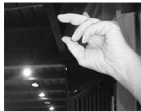
Diese Hand soll stellvertretend stehen für alle Hände, die sich bei den Wahlen ständig zustimmend hoben.