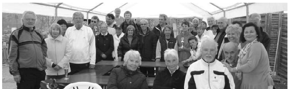
Etwas verfroren sehen sie ja aus, die Teilnehmer am Saison-Eröffnungsturnier 2012.