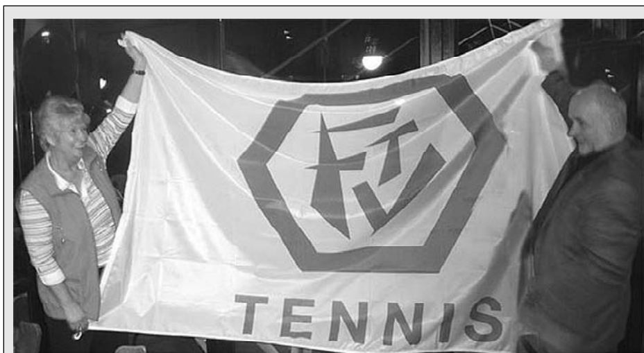
Geschenk Nr. 1: Eine neue Flagge für unseren Flaggenmast, denn Gudrun Nurrek-Baade packte das schiere Mitleid, wenn sie an der völlig zerfletterten Ferrari-Flagge vorbei ging, die unser Gastronom Manni Richter schon zu Schumi-Zeiten und nach jedem Formel1-Rennen gehisst hatte. Nun hat sie, also Gudrun, als geschickte Hausfrau Eigeninitiative ergriffen und in Eigenarbeit - Batik oder Häkelarbeit? - dieses wunderbare Stück Stoff gefertigt, das zukünftig unseren Mast schmücken und hoffentlich lange halten wird

Der Bericht der Kassenprüfer, vorgetragen durch Jochen Breetz rundete die gute Stimmung ab, denn es wurde in keinem einzigen Fall irgendeine Unstimmigkeit oder Fehlbuchung festgestellt. Die